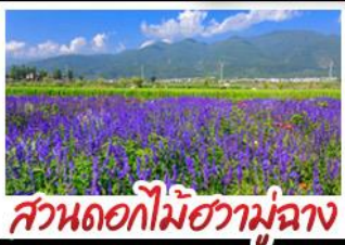
สวนดอกไม้ฮาวอวูมีฉ่าง