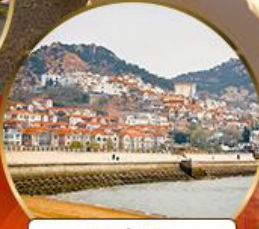
ซาจื่อโข่ว