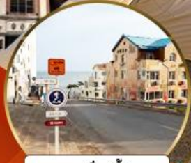
ถนนอ่าวจีป่า