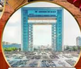
ประตูแห่งความสุข