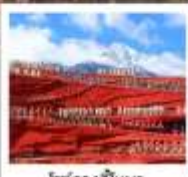
โชว์จางอีใหม่

พิเศษ!! รวมค่าเช่าชุดพื้นเมือง ...ที่เมืองโบราณลี้เจียง