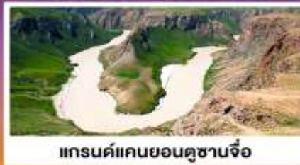
แกรนด์แคนยอนดูซานจื่อ