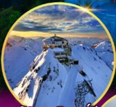
ยอดเขาซิลรอร์น