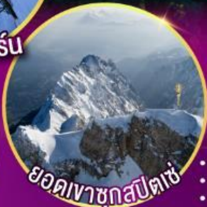
ยอดเขาซุกสปีตซ์