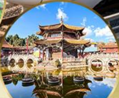
วัดหยวนทอง