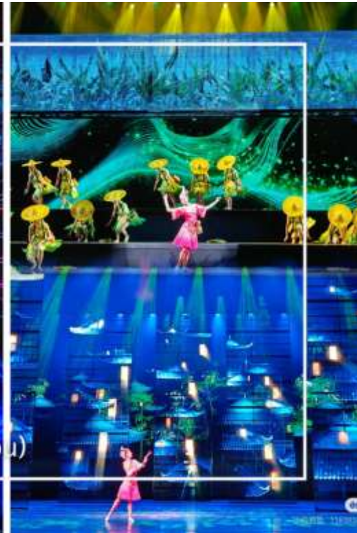
การแสดงโชว์ซีลิ่งคาปู (Xilan Kapu)

เดินทางเข้าโรงแรมที่พัก Xiazhou Hotel ระดับ 4 ดาวหรือเทียบเท่า