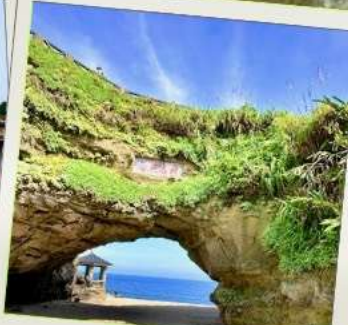
ถ้ำสี่เหมิน