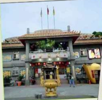
วัดจินซาน (โชคลาก)