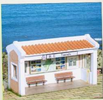
Tiaoshi Bus Station