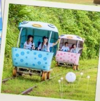
Shen'ao Rail Bike