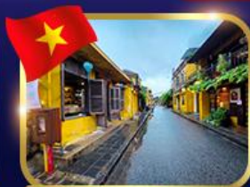
เมืองเก่าบรคโลก ฮอยอัน