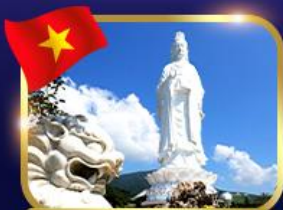
ขอพรองค์กวนอิม วัดหลินอึ้ง