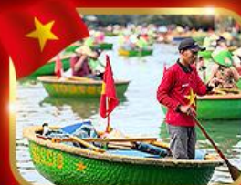
เรือกระด้ง หมู่บ้านกัมทาน