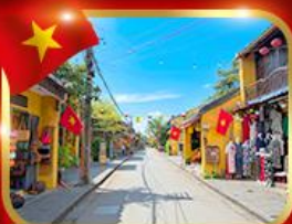
เมืองมรดกโลก ฮอยอัน