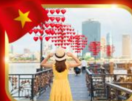
เช็กอินสะพานแห่งความรัก