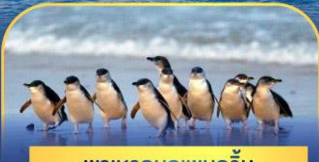
พาเหรดนกเพนกวิน