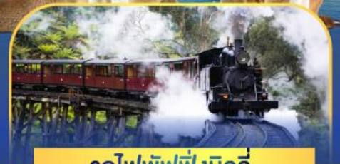
รถไฟพัพฟิงบิลลี่

ล่องเรือชมอ่าวซิดนีย์พร้อมรับประทานอาหารกลางวัน และ เข้าชมสวนสัตว์การองก้า