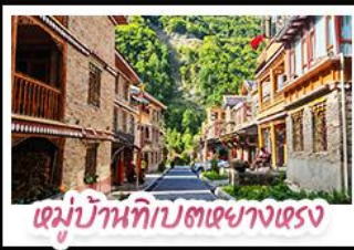
หมู่บ้านทิเบตเซียงแรง

ตะลุยเจียงตู คูหิมะต้ากู่ปิงชวณ ชมเช็กอินแพนด้ายักษ์ พักใจที่หยดน้ำตาสีฟ้า! แวะช้อปปิ้งโบราณลั่วใต้ สัมผัสบนตึกสนั้ท์ หมู่บ้านทิเบตทางทรงฮาตือ สัมผัสความหนาวเย็นที่ อุกยานสวรรค์ธารน้ำแข็งต้ากู่ปิงชวณ แหล่งรวมวิวหลักล้าน ตื่นตาไปกับแสงสียามค่ำคั่น หยดน้ำตาสีฟ้า ณ สะพานทนานเฉียว เมืองดูเจียงเยี่ยน ก่อนปิดท้ายด้วยการช้อปปิ้งจุใจ ถนนช้อปปิ้ง-ไถ่กุหลาบ และชะภาพกับ แพนด้าเซลฟี่ สุดคิวท์