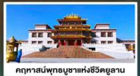
คฤหาสน์พุทธบูชาแห่งชีวีตยูลาน