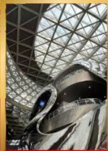
พิพิธภัณฑ์ศิลปะร่วมสมัยเซินเจิ้น