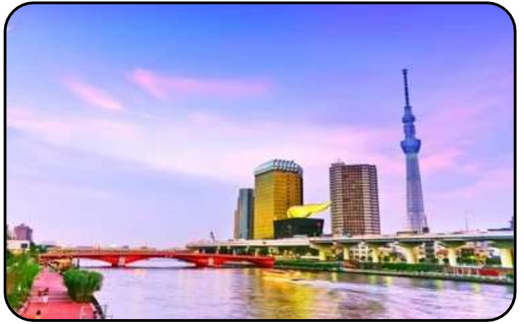
แม่น้ำสุมิดะ

สักการะ วัดมัตสึจิยามะโชเด็น หรือ “วัดหัวไชเท้า” ซึ่งเป็นวัดเก่าแก่ในย่านอาซากุสะ เป็นวัดเก่าแก่ในย่านอาซากุสะ กรุงโตเกียว ตั้งอยู่บนเนินเขาเล็ก ๆ ริมแม่น้ำสุมิดะ จุดเด่นคือเป็นวัดที่ขึ้นชื่อเรื่อง “ขอพรด้านการเงิน” โชคลาภ และความสำเร็จในธุรกิจ ส่วนไฮไลต์สำคัญของวัดนี้คือ ไคคอน หรือหัวไชเท้า สัญลักษณ์ศักดิ์สิทธิ์ คนที่นี่เชื่อว่าไคคอนช่วย “ชำระล้างสิ่งไม่ดี” และนำโชคลาภเข้ามา นักท่องเที่ยวมักนำไคคอนไปถวายเพื่อขอพร