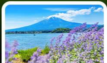
สวนโอะอิชิ ปาร์ค