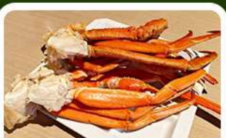
เมนูพิเศษ! ซาซิมิ

เกาะเอโนะชิมะ วิวสวยงามติด 1 ใน 100 ภูมิทัศน์ญี่ปุ่น พร้อมขอพรศาลเจ้าศักดิ์สิทธิ์ เที่ยวเต็มทั้ง 3 วัน แบบจุใจ ทั้งวัด ศาลเจ้า สวนดอกไม้ และช้อปปิ้ง