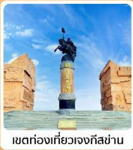
เขตท่องเที่ยวเจงกีสข่าน