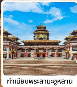
ทำเนียบพระลามะอูหลาน