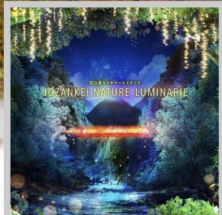
“JOZANKEI NATURE LUMINARIE”