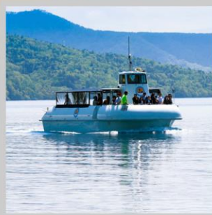
“LAKE SHIKOTSU GLASS BOAT”