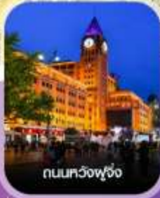
ถนนทวิงฟู่จิ่ง