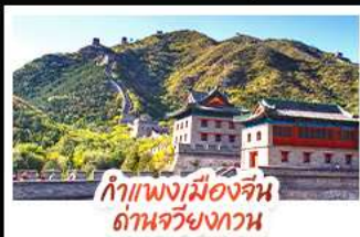
กำแพงเมืองจีน ด้านจวิ๋นกวาน

ล่องเรือสุดโรแมนติกแม่น้ำหวงผู้ ปักกิ่ง..เปิดประตูสู่แดนมังกร ด้วยความอลังการระดับจักรพรรดิ ชิงเต่า..เมืองชายทะเลสไตล์ยุโรป หลุหลุแบบผ่อนคลาย เซี่ยงไฮ้..มหานครแห่งเอเชีย เมืองที่ไม่เคยหลับใหล