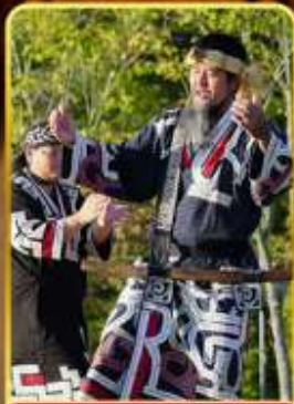
พิพิธภัณฑ์โอนู