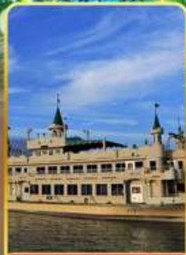
ล่องเรือทะเลสาบโทยะ