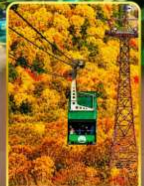
กระเช้าคุโรดากะ