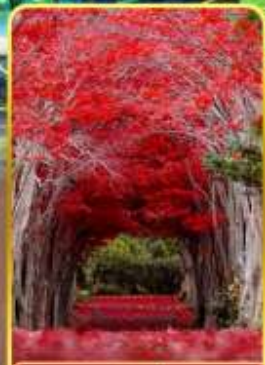
สวนฮิราโอกะ