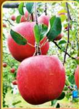
เก็บแอปเปิล