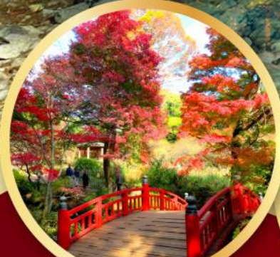
สวนดอกบ๊วยอาคาบิ