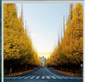
“ICHONAMIKI GINGO AVENUE”