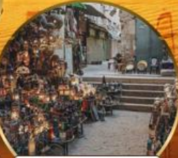
ตลาดบ้านเอลคาลิลี