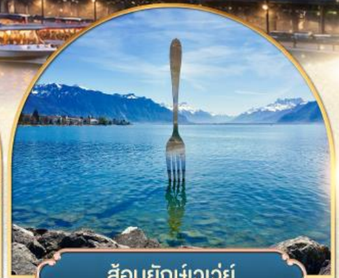
ส้อมยักเขาวัว