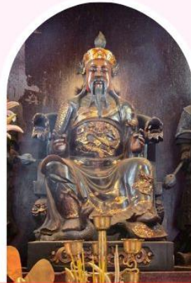
วัดปักโต เสริมโชคลาก นำพาความรุ่งเรือง