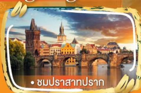
• ชมปราสาทปราก