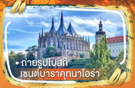
• ถ่ายรูปโบสถ์ เซนต์บาราคุกนาโอร่า