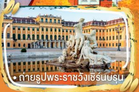
• ถ่ายรูปพระราชวังเซิร์นบรุน