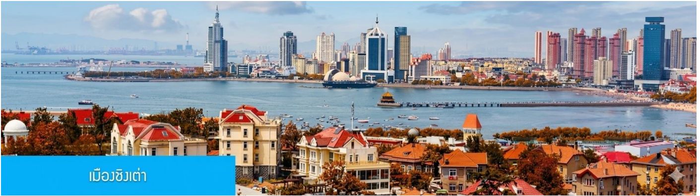
เมืองชิงเต่า