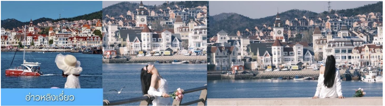
อ่าวหลังเจี้ยว

จากนั้นนำท่านเที่ยวชม อ่าวหลังเจี้ยว 菱角湾 เป็นอ่าวธรรมชาติและแลนด์มาร์กถ่ายรูปสุดฮิตในเมืองต้าเหลียน ประเทศจีน โดดเด่นด้วยทิวทัศน์บ้านเรือนสีแสนสดใสเรียงรายริมน้ำ จนได้รับฉายาว่า "Little Santorini แห่งต้าเหลียน" และเป็นจุดชมพระอาทิตย์ตกที่สวยงามมากแห่ง