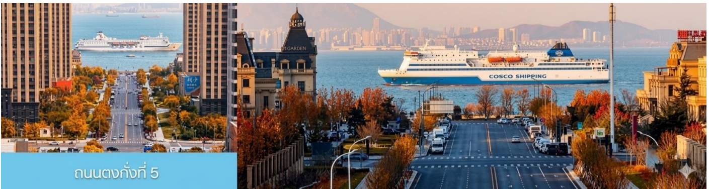
ถนนตงกั๊งที่ 5

จากนั้นนำท่านเที่ยวชม สวนน้ำเมืองเวนิสตะวันออก 大连东方威尼斯城 เป็นเมืองเวนิสจำลองที่ถูกสร้างขึ้นด้วยทุนกว่า 8,000 ล้านบาท ออกแบบโดยบริษัท ARC จากประเทศฝรั่งเศส โดยจำลองผังเมืองเวนิสในประเทศอิตาลี บนพื้นที่กว่า 400,000 ตารางเมตร ประกอบด้วยคลองเวนิสและอาคารที่มีสถาปัตยกรรมแบบตะวันตกกว่า 200 หลัง มีบริการล่องเรือกอนโดล่าแก่นักท่องเที่ยว นำท่านเดินชม ถ่ายภาพที่ระลึกท่ามกลางอาคารสไตล์ยุโรป ตามอัธยาศัย.