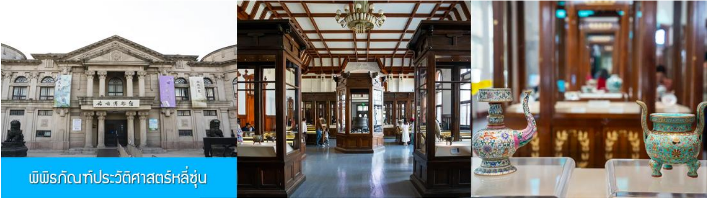
พิพิธภัณฑ์ประวัติศาสตร์หลี่ซุ่น

จากนั้นนำท่านเที่ยวชมและเก็บภาพ ณ พิพิธภัณฑ์ประวัติศาสตร์หลี่ซุ่น 庐山博物馆 เป็นอาคารพิพิธภัณฑ์เก่าแก่อายุกว่าร้อยปีแห่งแรกที่ยังคงสภาพดั้งเดิมทางภาคตะวันออกเฉียงเหนือของจีน อาคารพิพิธภัณฑ์มีความโดดเด่นด้วยสถาปัตยกรรมแบบกรีกโรมันยุคเรเนซองส์ ผสมผสานสถาปัตยกรรมแบบตะวันออก ภายในมีการจัดแสดงโบราณวัตถุกว่า 60,000 ชิ้น ท่านสามารถเก็บภาพที่ระลึกด้านหน้าอาคารพิพิธภัณฑ์ และสามารถเข้าชมโบราณวัตถุภายในพิพิธภัณฑ์ได้ตามอัธยาศัย (พิพิธภัณฑ์ปิดทุกวันจันทร์)..