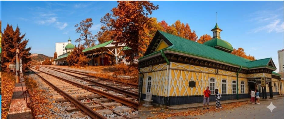
สถานีรถไฟหลี่ซุ่น

นำท่านเที่ยวชมและเก็บภาพ ณ สถานีรถไฟหลี่ซุ่น 旅顺火车站 เป็นสถานีปลายทางของเส้นทางรถไฟสาขา เส้นหยาง - ต้าเหลียน สร้างขึ้นในปีค.ศ. 1903 ออกแบบโดยสถาปนิกชาวรัสเซีย เป็นอาคารอิฐก่อปูนผสม โครงสร้างไม้ตามสถาปัตยกรรมรัสเซีย.