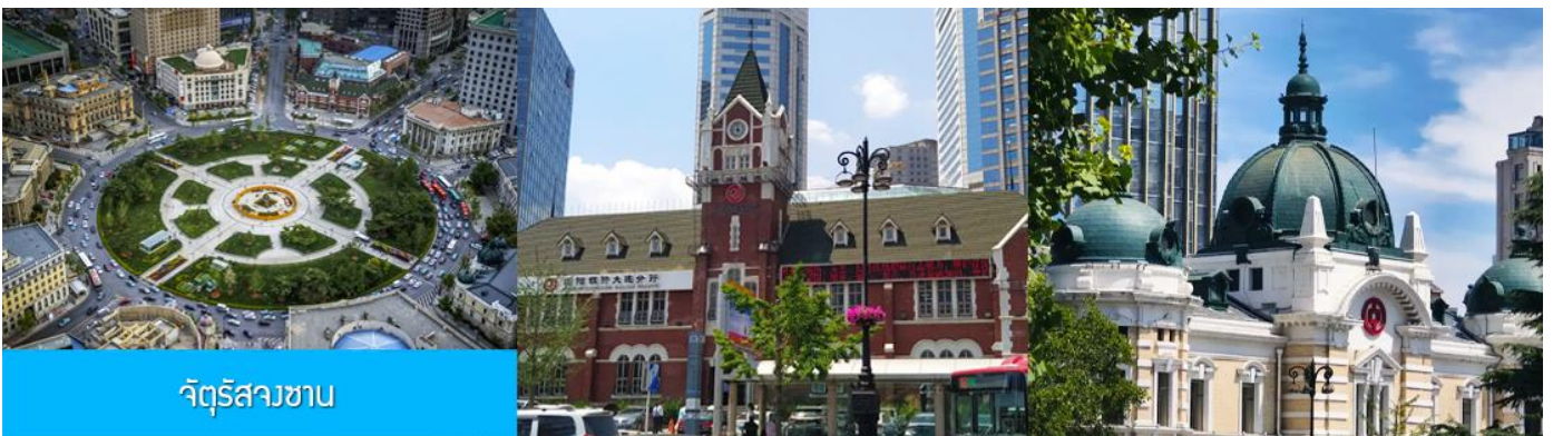
จัตุรัสวงเวียน

จากนั้นนำท่านเที่ยวชม อ่าวหลังเจี้ยว 菱角湾 เป็นอ่าวธรรมชาติและแลนด์มาร์กถ่ายรูปสุดฮิตในเมืองต้าเหลียน ประเทศจีน โดดเด่นด้วยทิวทัศน์บ้านเรือนสีแสนสดใสเรียงรายริมน้ำ จนได้รับฉายาว่า "Little Santorini แห่งต้าเหลียน" และเป็นจุดชมพระอาทิตย์ตกที่สวยงามมากแห่ง