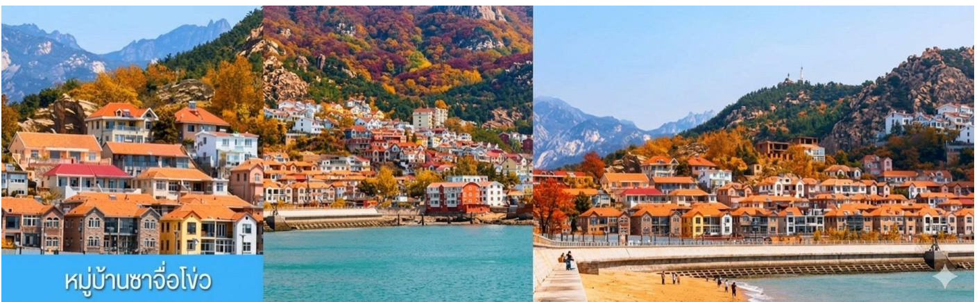
หมู่บ้านชาวโจว