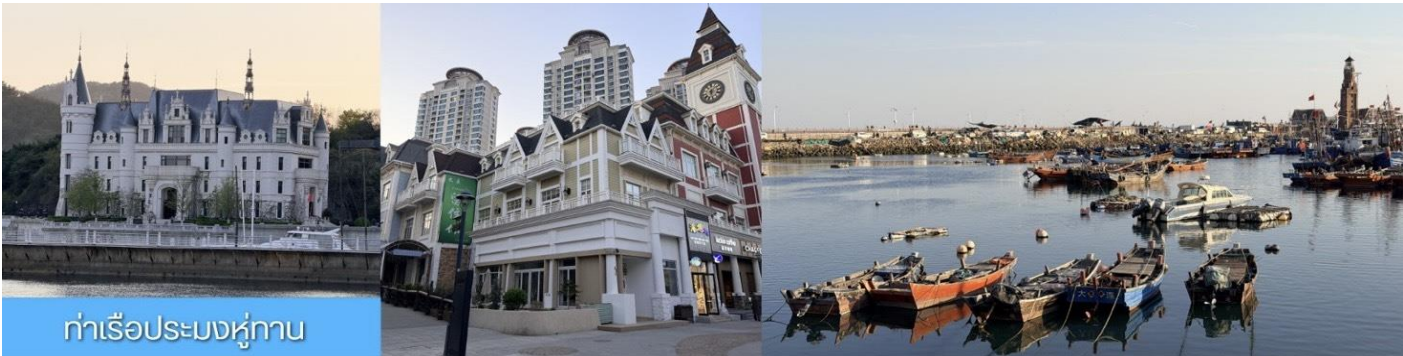
ท่าเรือประมงหู่กาน

พักที่ DALIAN JUZISHUIJING HOTEL หรือ โรงแรมระดับ 4 ดาวท้องถิ่น เมืองต้าเหลียน