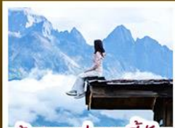
ร้านอาหารทะเลยูนนาน

ชมวิวภูเขาหิมะสวยสุดโรแมนติกกับแสงยามพลบค่ำ เที่ยวเมืองโบราณต้าหลี่ ลี้เจียง ป่าชา แซงกรี่ล่า ชมวิถีชีวิตของชุมชนยูนนานและทิเบต พิสูจน์ความกล้าท้าเดินชมสะพานแก้วลี้เจียง • ซุปโป่งเพลินที่ถนนคนเดินหนานผิงเจีย