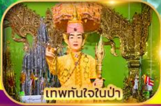
เทพทันใจในป่า