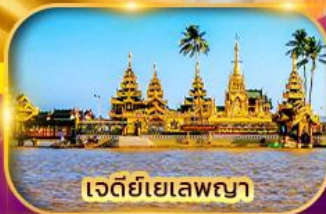
เจดีย์เยเลพญา