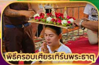
พิธีครอบเศียรเทีร์นพระธาตุ