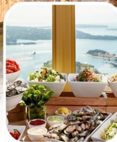
SKYFEAST BUFFET SYDNEY TOWER