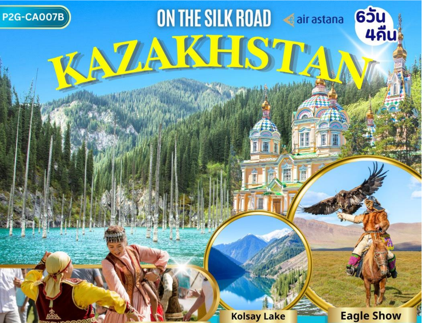
Huns Ethno Village