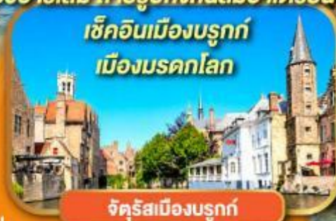
จัตุรัสเมืองบรูค