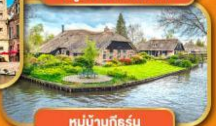
หมู่บ้านก็ธูร์น