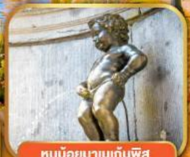
ทูน้อยมาบนแท่นพิส