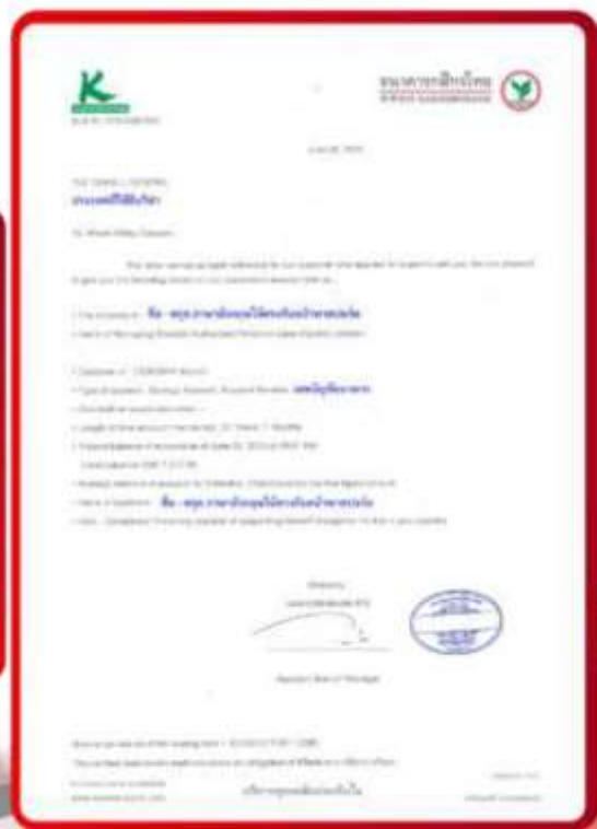
ตัวอย่าง Bank Guarantee ที่ผู้สมัครต้องขอเกี่ยวกับธนาคาร