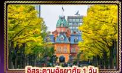
ฮิโระ-ตามฮิโระ 1 วัน

น้ำหนักกระเป๋า 20 Kg. บริการอาหาร บนเครื่อง ไป-กลับ