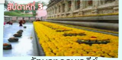
รัตนองกรมเจดีย์