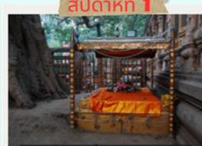
พระแท่นวิหารอาสน์