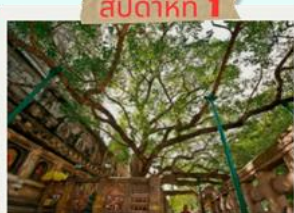
ต้นพระศรีมหาโพธิ์