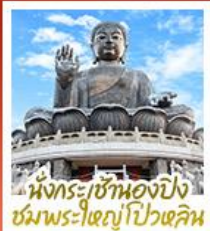
นั่งกระเช้ามองปิง ชมพระใหญ่ไปหวลิม

นั่งกระเช้ามองปิงสีกการะพระใหญ่ไปหวลิม • วัดหวังต้าเซียน ขอพรสุขภาพ ความรัก วัดเขกงหนิว ขอพรองค์เขกง โชคลาก การเงินและธุรกิจ • เจ้าแม่กวนอิมรพีลาลัย รับพลังงานดี เสริมพลังฮวงจุ้ย • วัดมื่นไทมว ขอพรเรื่องการศึกษา การงาน สติปัญญาและความกล้าหาญ