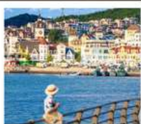
อ่าวหลงเจียง