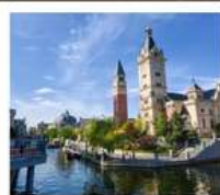
เมืองเวนิสแห่งต้าเหลียน