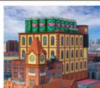
โรงเบียร์สิงคโปร์