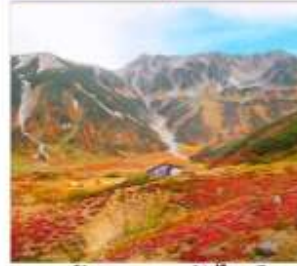
เส้นทางสายอัลไพน์ ทาเทยาม่า