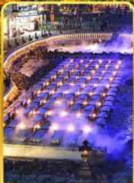
ชมยูบาทาเกะ