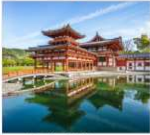
วัดเมียวโตจินและ ถนนซาเจียว