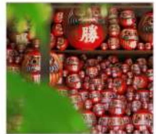
วัดคัตสึโองิ