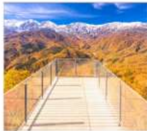
นั่งกระเช้าฮาคุมะ