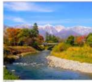
โออิเดะปาร์ค