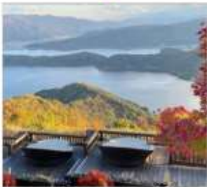
จุดชมวิวทะเลสาบทั้ง 5 ของมิกากะ