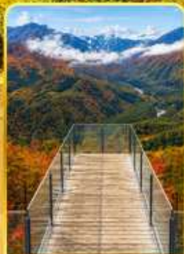
ฮาคูบะอิวาตาคะ