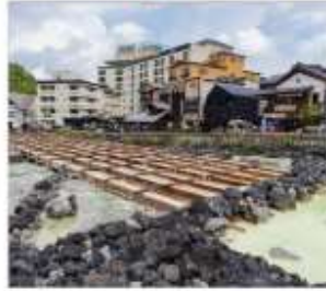
ชมยูนาทาเกะ