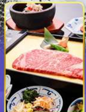
ROKKASEN พรีเมียม