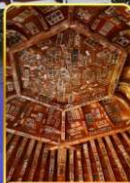
วัดซาชะเอโดะ