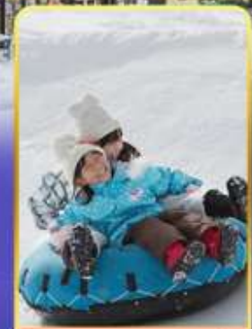
กิจกรรม ณ ลานสกี