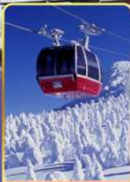
นั่งกระเช้าขึ้นเขาซาโอะ