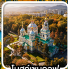
โบสถ์เซนคอฟ

นั่งกระเช้าคอนโดล่าขึ้นสู่ชิมบูลัก สตรีสออร์ก ไร่มุกแห่งเทือกเขาเทียนชาน ทะเลสาบโคลไซ หุบเขาเจดี ไอกูซ / ภูเขาหินเทพนิยาย / ทะเลสาบอีสซิกกุล ชมการแสดงการล่าเหยื่อของนกอินทรี