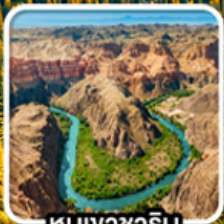
หุบเขาซาริน