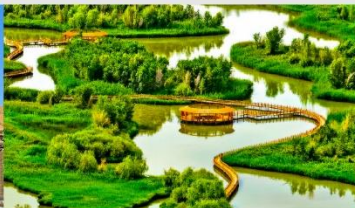
อุทยานพื้นที่ชุ่มน้ำจางเย่