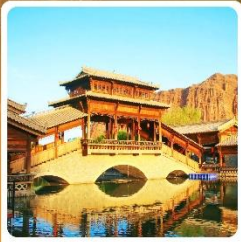
เมืองเล็กตันเสี่ยโซ่ว