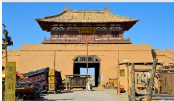
เมืองโบราณตุนหวง