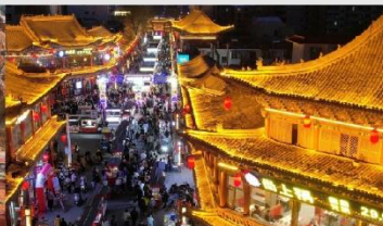
ตลาดกลางคืนจางเย่

*ทางบริษัทฯ ขอสงวนสิทธิ์ในการสลับโปรแกรมทัวร์ตามความเหมาะสมขึ้นอยู่กับสถานการณ์หน้างาน โดยคำนึงถึงผลประโยชน์ของลูกค้าเป็นสำคัญ