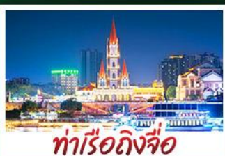
ท่าเรือกิ่งจื่อ

เขาชิงชิวสวนดอกไม้ตามฤดูกาล หมู่บ้านสไตล์ยุโรปเที่ยงยวี่ มังซิง เสี่ยวเจี้ยน ถนนคนเดิน NANNING ZHIYE - เมืองโบราณไท่ผิง ท่าเรือกิ่งจื่อ - ถนนคนเดิน สามตรอกสองซอย