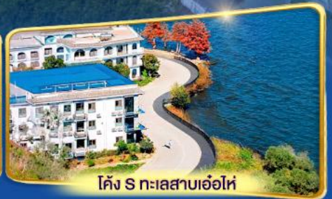
โค้ง S ทะเลสาบเอ่อไห่