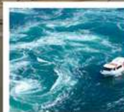
คลองเรือขมบ้านนาสุโตะ

คลองเรือขมบ้านนาสุโตะ / ซุปบึงย่านชินโซบาช / ตลาดปลาคุโรเมง / ซุปบึงย่านอุมาตะ