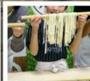
กิจกรรมทำเส้นอุด้ง