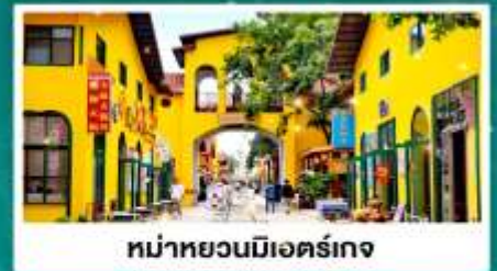
หม่าหยวนมีเออร์เกง