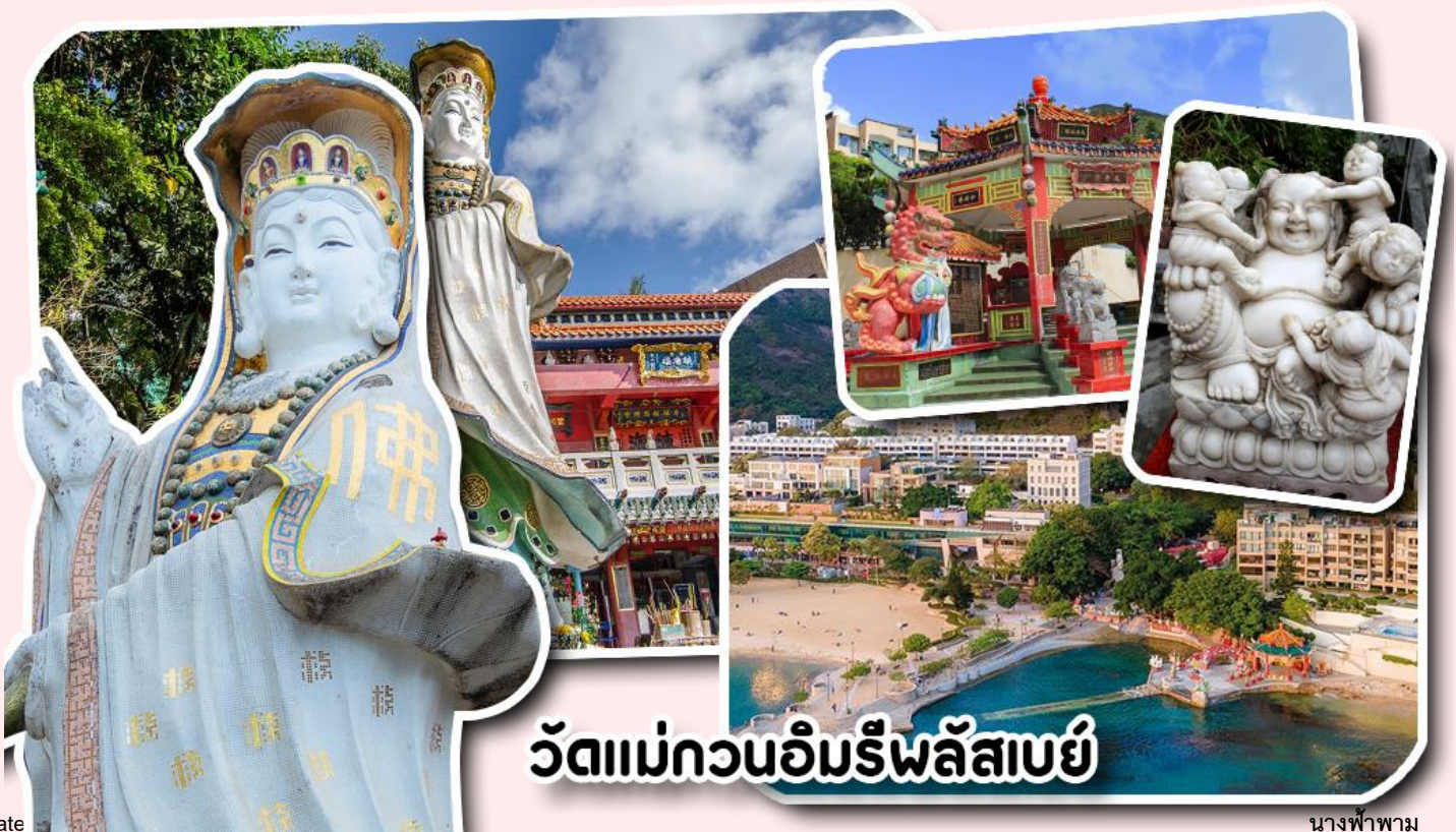
วัดแม่กวนอิมรีพลัสเบย์

จากนั้นพาท่านเดินทางไปนมัสการ เจ้าแม่กวนอิมริมหาดรีพลัสเบย์ วัดแห่งนี้ถูกสร้างขึ้นเพื่อคุ้มครองชาวประมงเวลาออกเรือไปหาปลาในสมัยก่อน บริเวณวัดมีสิ่งศักดิ์สิทธิ์มากมาย ได้แก่ เจ้าแม่กวนอิม ประดิษฐานอยู่ทางด้านซ้ายของวัด ซึ่งผู้คนนิยมเดินทางไปกราบไหว้ขอพรเรื่องการมีบุตร และยังมีพระสังกัจจายที่เชื่อกันว่าสามารถขอเพศของบุตรที่จะมาเกิดได้ โดยหลังจากกราบไหว้แล้วก็ให้ลูบที่ท้องของพระสังกัจจาย ถ้าอยากได้ลูกชายให้ลูบท้องซ้าย อยากได้ลูกสาวให้ลูบท้องขวา ถัดมาคือ เจ้าแม่ทับบิมเทพีแห่งท้องทะเล ท่านจะคอยคุ้มครองผู้เดินทางทางเรือ หรือผู้ที่เดินทางไปไหนมาไหนท่านจะคอยคุ้มครองให้ปลอดภัย และมีโชคลาภ ถัดจากบริเวณที่กราบไหว้ขอพร ก็จะมีศาลาแปดเหลี่ยมริมน้ำ และสะพานเล็กๆ ที่ชื่อว่าสะพานต่ออายุ ซึ่งเชื่อกันว่าหากเดินข้ามสะพานแห่งนี้ 1 ครั้ง ก็จะมีอายุยืนขึ้น 3 ปี