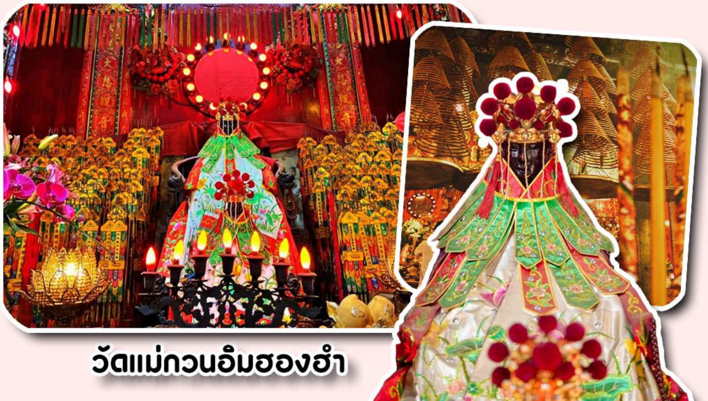
วัดแม่กวนอิมฮ่องฮ่า

พาท่านเดินทางไปที่ ไหว้ขอพรขอเงิน วัดแม่กวนอิมฮ่องฮ่า วัดเก่าแก่ของฮ่องกงสร้างตั้งแต่ปี ค.ศ. 1873 เป็นวัดขนาดเล็กที่มีชาวฮ่องกงศรัทธาแน่นถือกันเป็นอย่างมาก วัดแห่งนี้เป็นที่ประดิษฐาน องค์เจ้าแม่กวนอิมฮ่องฮ่า ที่มีชื่อเสียงเรื่องการให้กู้ยืมเงิน เชื่อกันว่าท่านช่วยพลิกฟื้นเศรษฐกิจของชาวฮ่องกง ผู้คนจึงนิยมมาขอยืมเงินทำธุรกิจจนสำเร็จร่ำรวย รุ่งเรือง โดยให้ท่านอธิษฐานขอพรต่อหน้าเจ้าแม่กวนอิมฮ่องฮ่า พร้อมกับระบุวันเวลาในการขอพรด้วย จากนั้นนำธูปธบายตามฐานะและศรัทธาที่เราจะนำเป็นสื่อในการขอพร เขียนจำนวนเงินที่ต้องการลงไปด้วย ใส่สกุลเงินยิ่งดีใหญ่ แล้วนำเงินใส่ในซองแดง ควรเตรียมซองแดงไปเอง นำซองแดงไปวนรอบกระถางธูป วนขวาจำนวน 3 ครั้ง แล้วเก็บซองแดงในกระเป๋าสตางค์ เป็นเงินขวัญถุง ถ้าประสบความสำเร็จตามที่มุ่งหวัง ให้นำเงินในซองแดงทำบุญหยอดตู้ที่วัดแห่งนี้ในโอกาสต่อไป วิธีไหว้ให้ปัง ให้ได้โชคลาภเงินทอง ต้องไปกับเราเท่านั้น