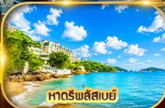
หาดริพลัสเบย์