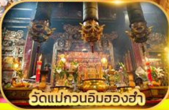
วัดแม่กวนอิมสองอ่า