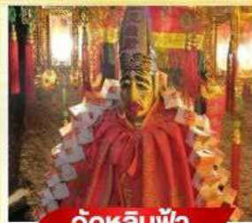
วัตต์หลินฟ้า