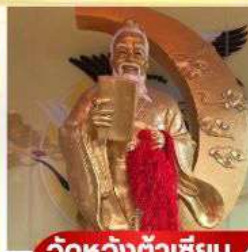
วัตต์ห้วงต้าเซียม