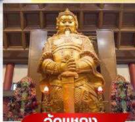
วัตต์แชงก