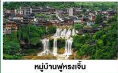
หมู่บ้านฟุหลงเจิน